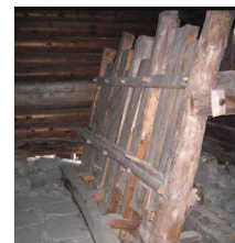
Fra stampa på Norsk Folkemuseum.