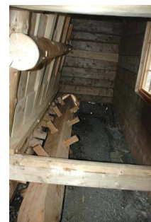
Den kraftige akslingen med haker løfter de tunge tømmerstokkene og slipper dem ned i «bryå» på framsiden, der tøyet ligger. Foto fra kopibygningen i Stordal.

Svar fra Norsk Etnologisk Gransking sin spørrelister om tøystampen finner du her