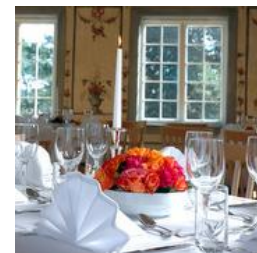
Festsalen i Norsk Folkemuseums Gjestestuer gir en vakker ramme for selskaper og spesielle anledninger.